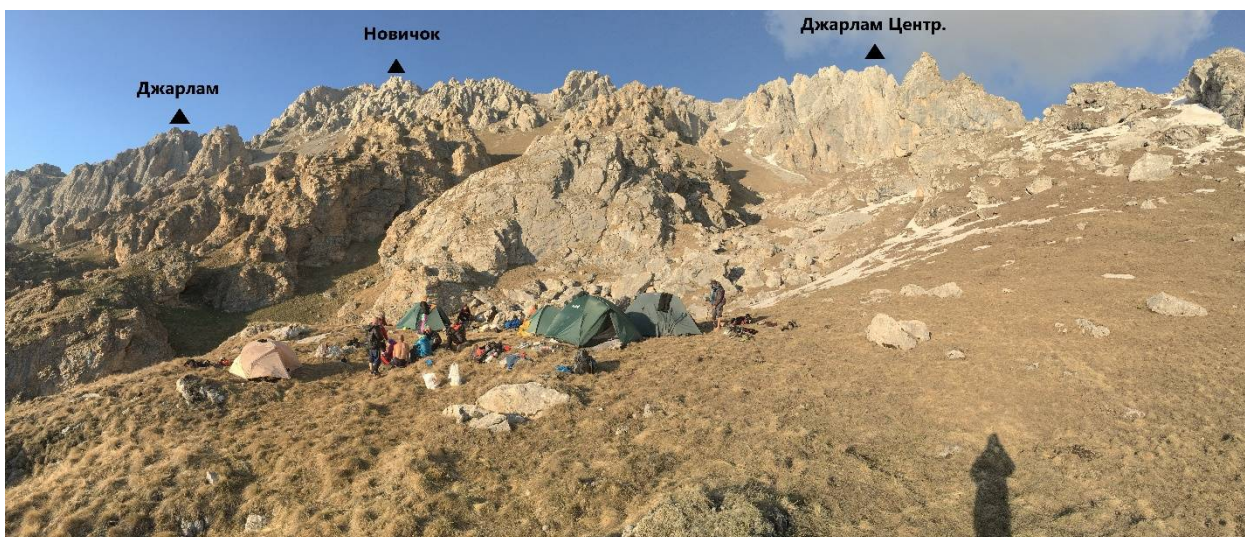
Фото 2. Панорама гребня и лагерь на перевале Джарлам.