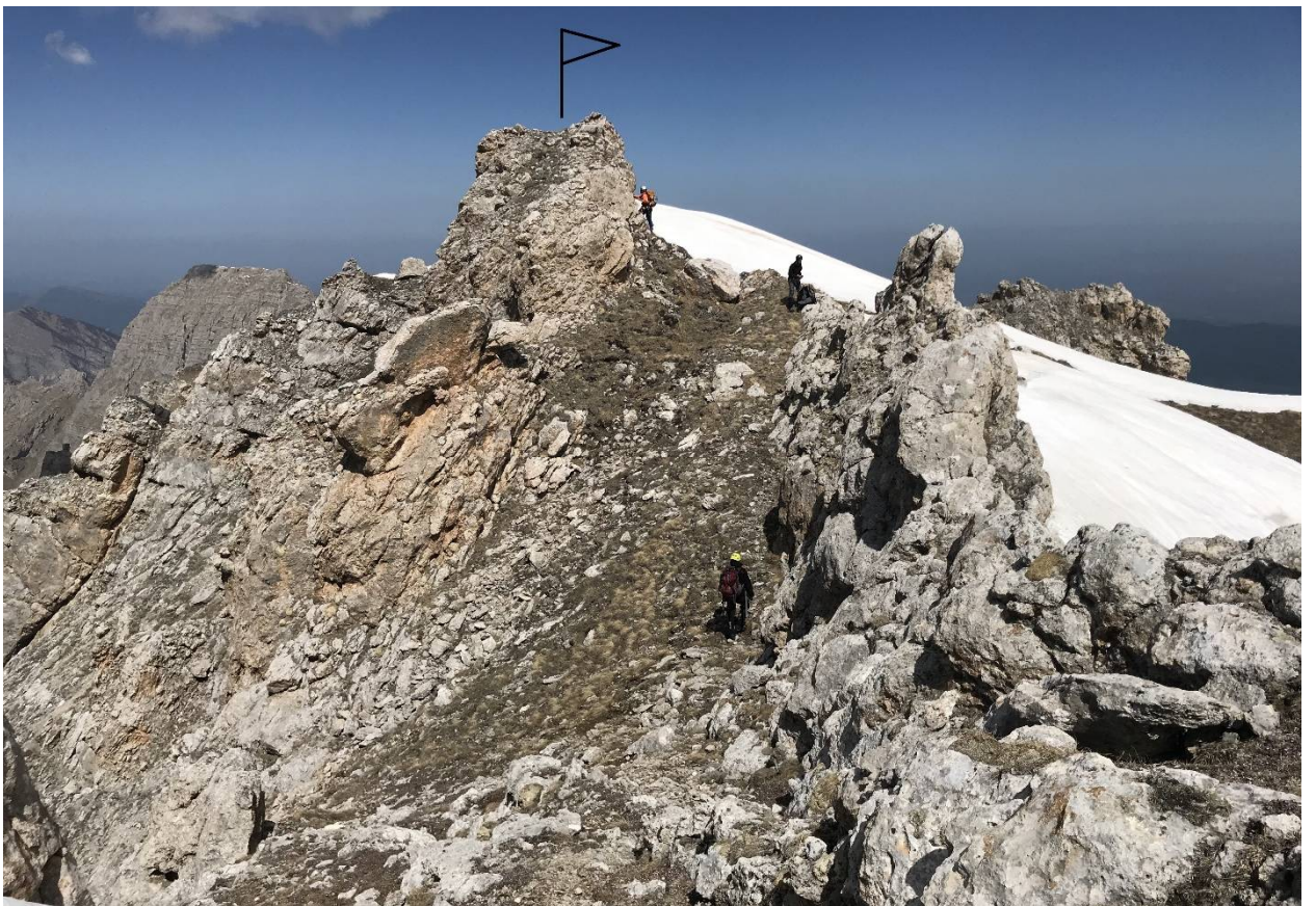
Фото 6. Вершина.