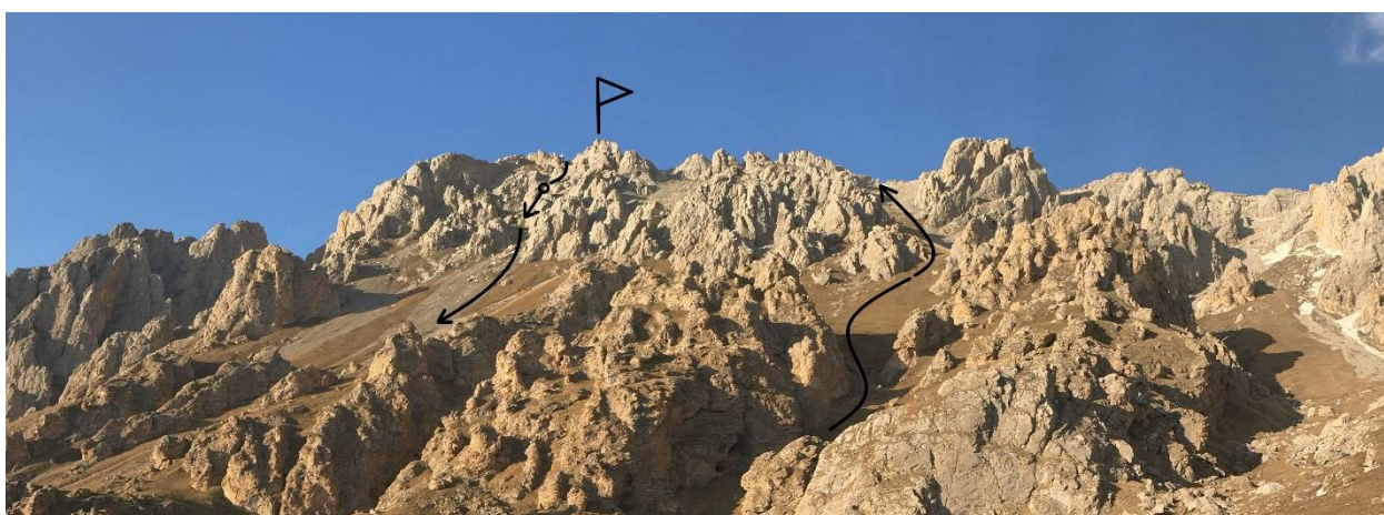
Фото 3. Подход и спуск.