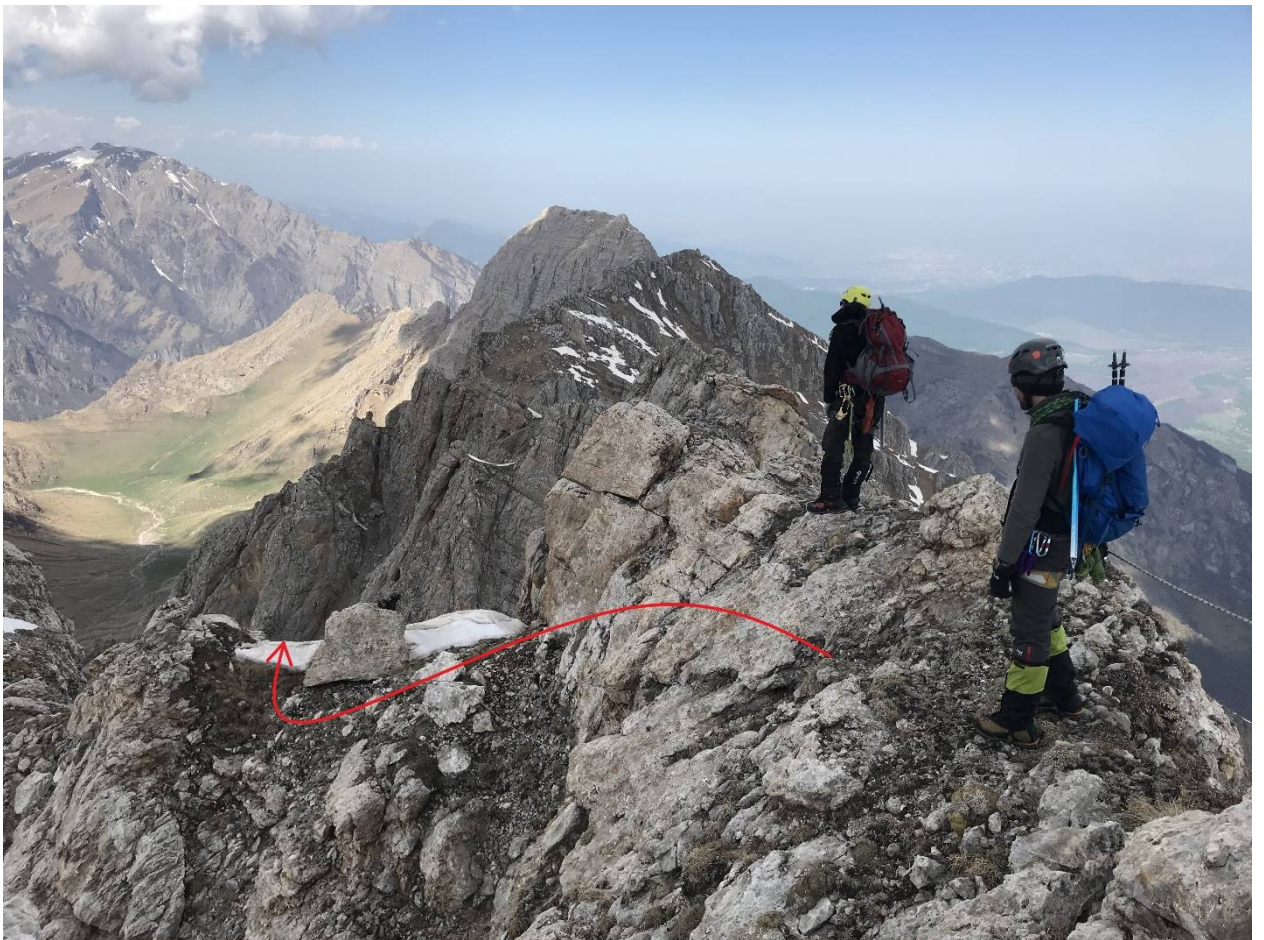
Фото 8. Спуск к провалу в гребне.