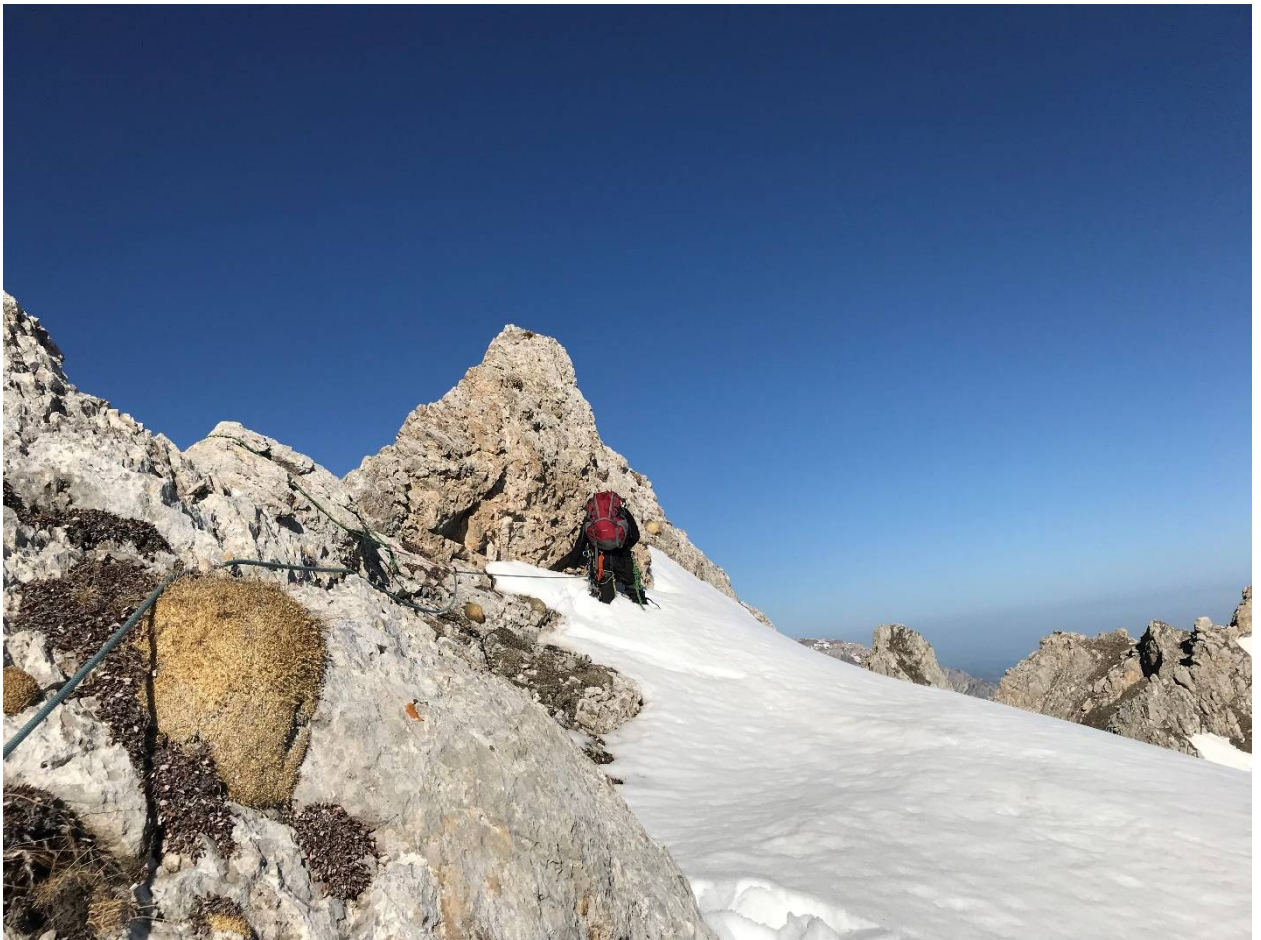
Фото 4. Начало маршрута.

Через 160 метров провал в гребне, дюльфер (10 метров). Место для дюльфера удобное. После дюльфера подъем на разрушенный жандарм. С жандарма лазанием вниз в небольшой провал в гребне. Страховка, камнеопасно! Далее движение по гребню одновременно, страхуясь за выступы, до взлета гребня, который преодолевается по полке с правой стороны и затем по внутреннему углу, выводящему вверх на гребень. Для страховки было использовано 2 закладных элемента. Далее по простому гребню до вершины Новичок. От дюльфера до вершины 250 метров. На вершине тур.