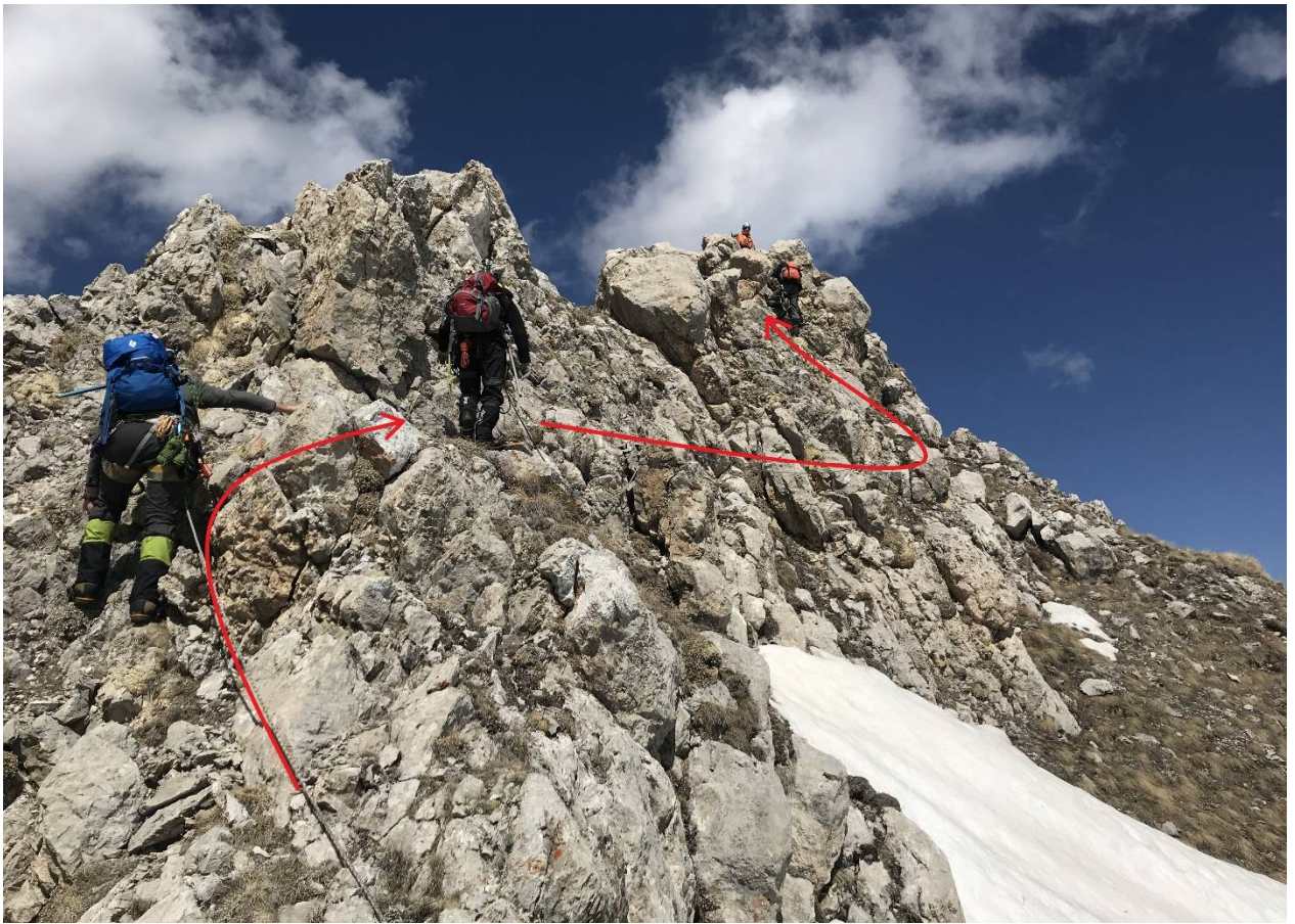
Фото 5. Взлет гребня.