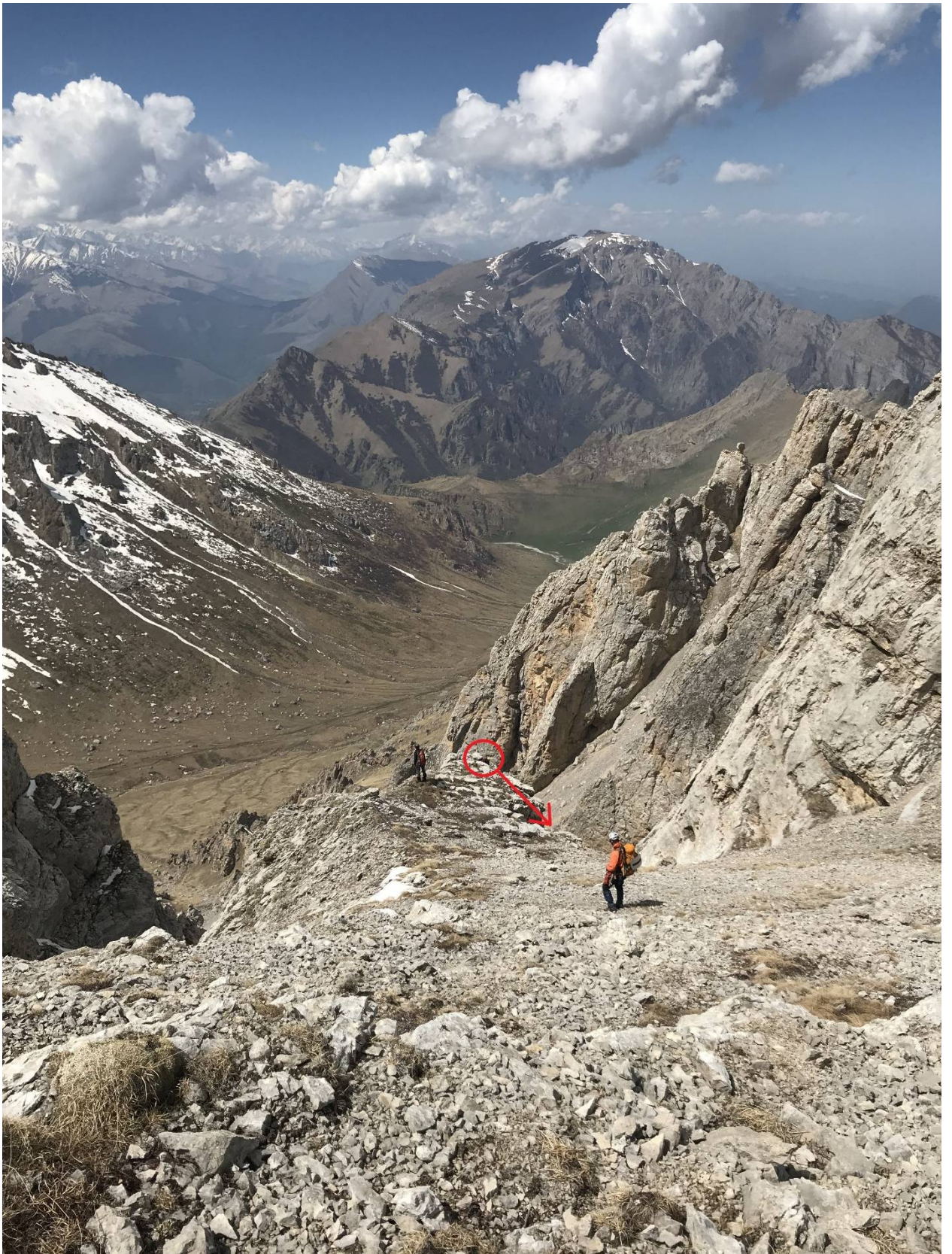
Фото 9. Дюльфер на спуске.