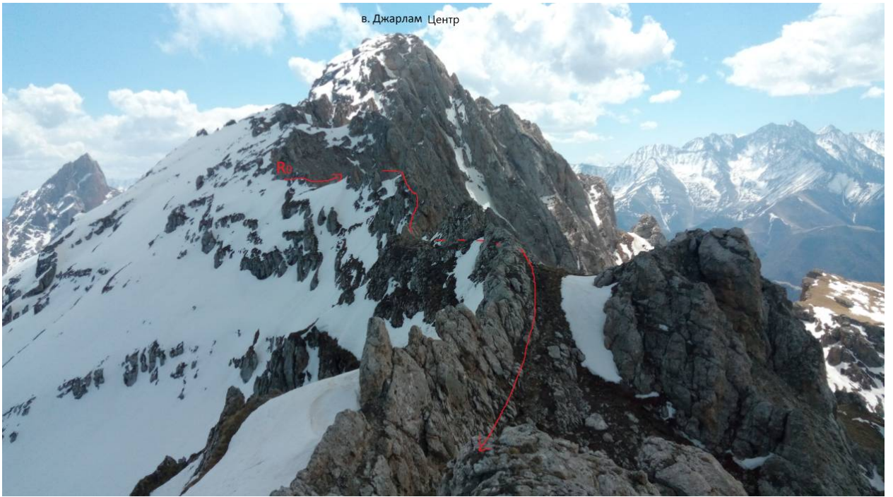
Фото 7. Вид с вершины на маршрут.